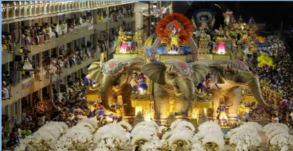
KARNAWAŁ, RIO DE JANEIRO, 2014

Największym balem karnawału w Rio de Janeiro rozpoczynający się w ostatni piątek przed Środą Popielcową i trwający przez pięć dni aż do środy nad ranem.