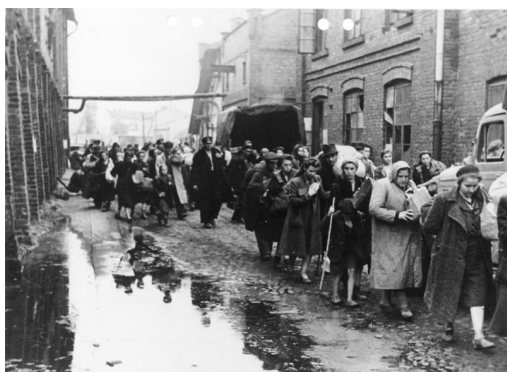
3 September 1944