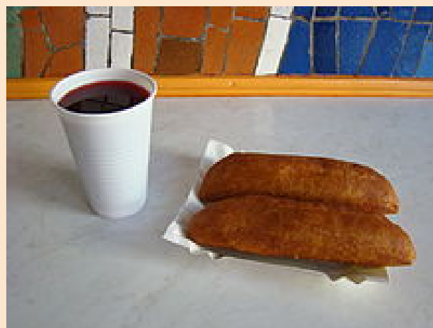
Paszteciki szczecińskie serwowane z czerwonym barszczem

Pasztecik szczeciński – rodzaj smażonego ciasta drożdżowego nadziewanego zwykle mieszankami mięsnymi, rzadziej jarskimi, danie typowe dla Szczecina, uważane za jeden z symboli miasta i jego mieszkańców. Nadzienie składa się najczęściej z wieprzowiny połączonej z wołowiną, kapusty z grzybami bądź sera i pieczarek. W czasach Polskiej Rzeczypospolitej Ludowej dość powszechnym zjawiskiem było zastępowanie farszu mięsnego pastą jajeczną. Ciasto z zewnątrz jest kruche, jednak w środku ma delikatną i miękką konsystencję. Pasztecik serwowany jest zazwyczaj z niezabielanym, mocno przyprawionym czerwonym barszczem.