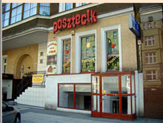
Najstarszy bar serwujący paszteciki przy al. Wojska Polskiego 46 w Szczecinie

Pierwszy bar „Pasztecik” został otwarty w październiku 1969 roku, przy alei Wojska Polskiego 11, vis a vis kina „Kosmos”. Sześć lat później przy al. Wojska Polskiego 46 powstał kolejny bar, oferujący drożdżowe wypieki i do dziś pozostał jedynym miejscem serwującym wyroby według nieziennej receptury. Bar „Pasztecik” spod numeru 11 przeniósł się pod numer 46, do swojej filii, ponieważ pawilony, w których się mieścił, zostały wyburzone na początku lat 90.